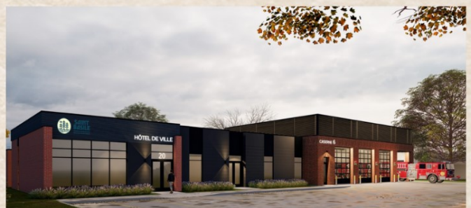
Illustration de la future Caserne des incendies qui devrait être inaugurée en 2025.

Le 18 octobre 1970 une toute nouvelle caserne est inaugurée sur la rue Saint-Georges (autrefois appelée la rue Garnier). Cette caserne a été utilisé par le service des incendies jusqu'en mars 2024.